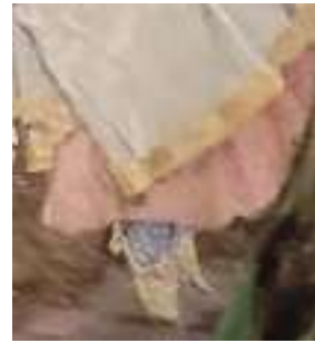
Рис 11. Иван-царевич на сером волке (фрагмент эскиза)

На эскизе, находящемся в доме-музее В.М. Васнецова (рис. 11), скорее всего, изображены получившие распространение в 16-17-ых веках башмаки — обувь без голенищ, на разных по форме, ширине и высоте каблуках. Башмаки охватывали только ступню, поэтому к ним требовалось надевать согревавшие ноги от щиколотки до бедра чулки [8]. А на экспонирующейся в Третьяковской галерее картине, Елена Прекрасная обута в остроносые сафьяновые сапоги на высоком каблуке с золотым орнаментом — чедыги (ичетыги) (рис.10). На наш взгляд, цвет сапожек не очень гармонирует с голубым нарядом королевы. Скорее всего, художник сделал это намеренно, указывая на восточное происхождение сапожек (зеленый - священный цвет мусульман). Подобные сапожки носили и до сих пор носят татары.