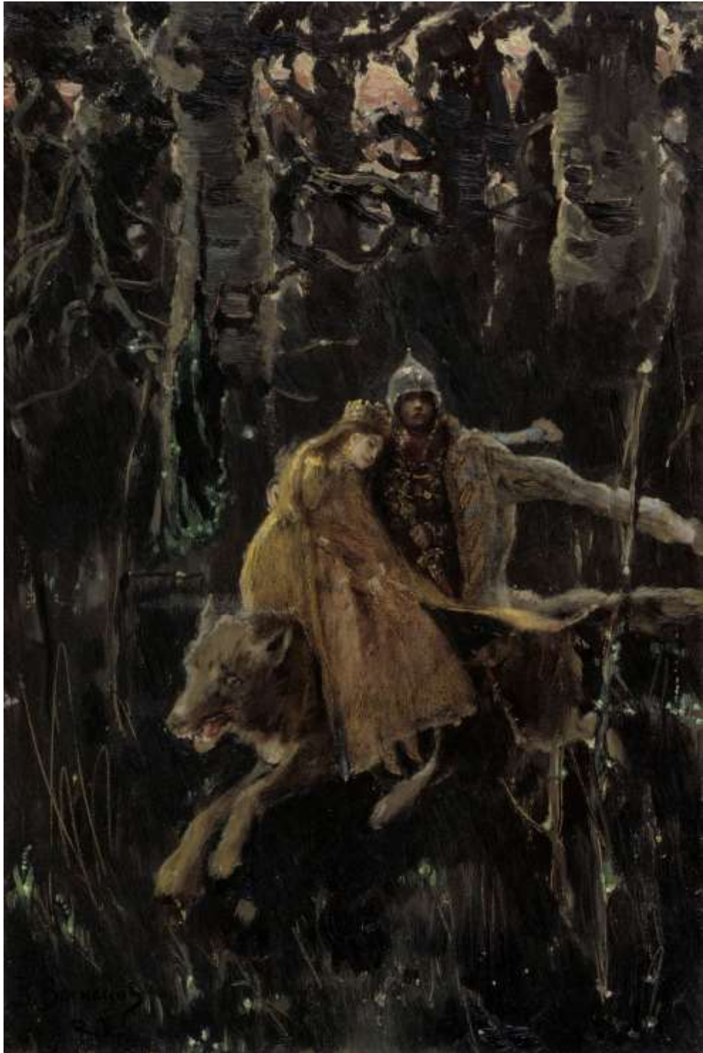
Холст, масло. 57 х 38 см. 1880 г. Финская Национальная галерея, Хельсинки