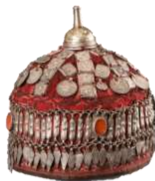
туркменский головной убор