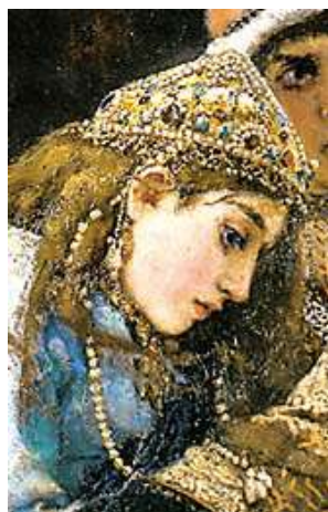
Рис. 8. Иван-царевич на сером волке (фрагмент)