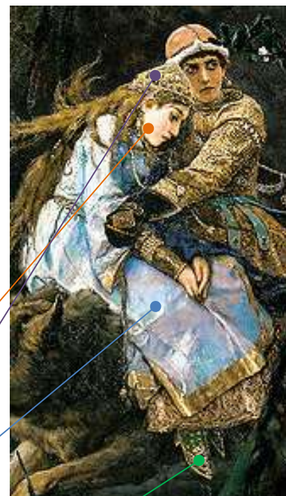
«Иван-царевич на сером волке» (фрагмент)