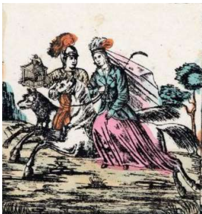
Сказка о Иване царевиче, жар птице и сером волке. Фрагмент