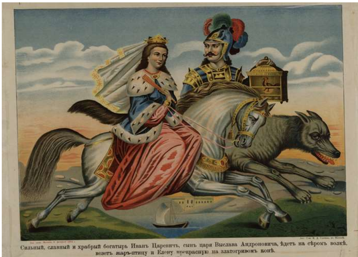
Сильный, славный и храбрый богатырь Иванъ Царевичъ, сынъ цари Вяслава Андроновича, ѣдетъ на сѣромъ волкѣ, везетъ жаръ-птицу и Елену прекрасную на златогривомъ конѣ.

Неизвестный художник. Сильный славный храбрый богатырь Иван Царевич. Бумага, литография, 1894 г. Лит. Т-ва И.Д. Сытина. Лубки из собрания Д. Ровинского, Нью-Йоркская публичная библиотека