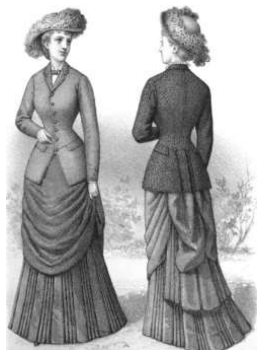
Рисунок из журнала "Новейшая парижская мода", 1877 г.