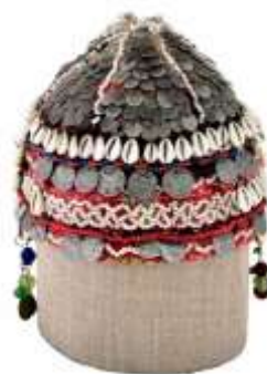
Рис. 9. Такья. Лен, стекло, раковины каури, олово, серебро. Начало 20 в. Национальный музей Удмуртской Республики

На наш взгляд, головной убор королевы напоминает тибетейку. Девичьи шапочки-тибетейки распространены у народов Поволжья, Урала, Средней Азии, Кавказа, Крыма (Приложение 8). Подобную шапочку мы видели в Национальном музее Удмуртской Республики. Она называется такья (тахья). Такую шапочку, сшитую из 1–2 слоёв плотного холста или кожи и украшенную бисерным узором и монетами носили, бесермянские девушки (рис.9). Бесермяне – малочисленный фино-угорский народ в России,