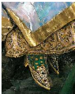
Рис 10. Иван-царевич на сером волке (фрагмент картины)

Обувь Елены Прекрасной. Русские женщины носили кожаные и текстильные сапоги и башмаки. До 17-го в. обувь была без каблуков, затем появился высокий (5-8 см) каблук. Исключительно для царской семьи из дорогих материалов (бархата, сафьяна, атласа) шили чеботы - глубокие башмаки на каблуках с острыми, загнутыми вверх носками. (Приложение 9).