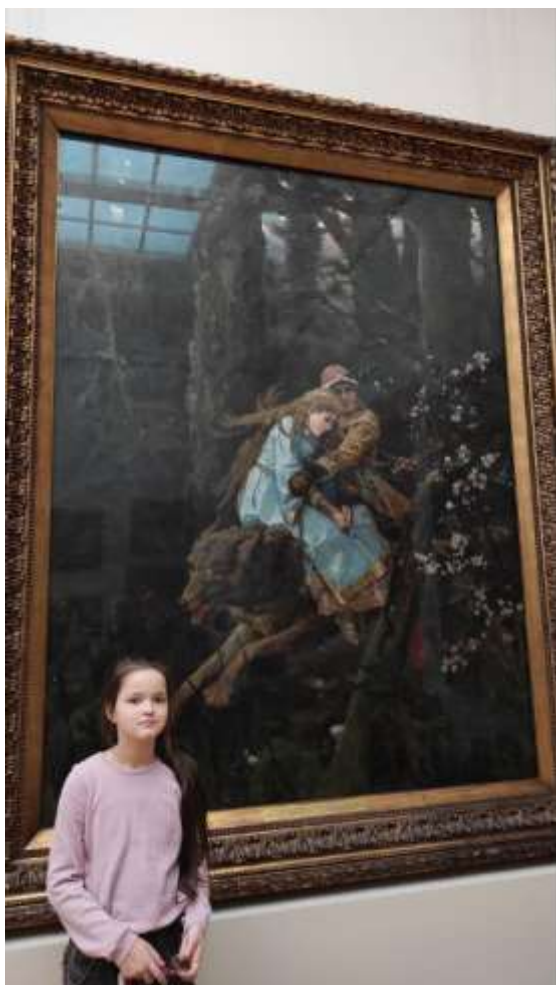
Государственная Третьяковская галерея