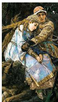
Рис. 5. Иван-царевич на сером волке (фрагмент)