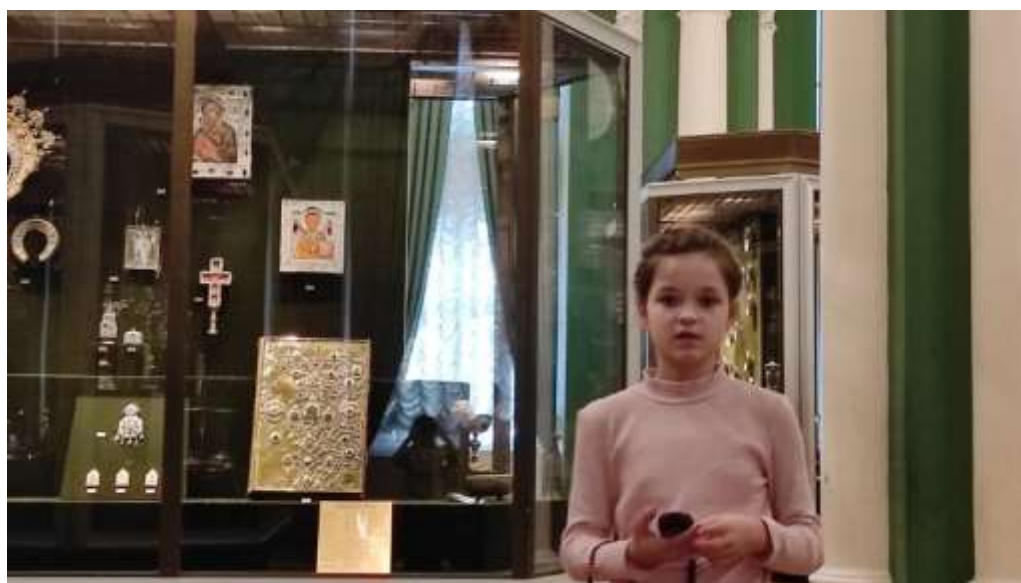
Оружейная палата, Музеи Московского Кремля