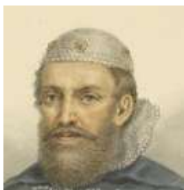
Рис. 7. Ф. Г. Солнцев. Из альбома "Одежды Русского государства". Бумага, хромофотография. 53x38,7 см. 1869 г. Государственный исторический музей

Голову Елены Прекрасной покрывает расшитая драгоценными камнями и жемчугом круглая остrokонечная шапочка, от которой вдоль щек спущены рясны (рис. 8). Искусствовед А. Боровский, на лекции которого мы побывали в декабре 2022 г., считает, что это распространенная в 16-17ых веках у привилегированных сословий мужская шапочка тафья (рис. 7). По его мнению, соединение в костюме женских и мужских предметов одежды указывает на неопределенность положения королевы [1].