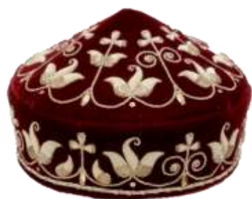
татарский головной убор