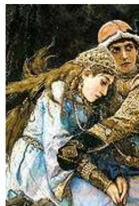
Рис. 3. Иван-царевич на сером волке (фрагмент)

Одежда и украшения Елены Прекрасной. На картине королева изображена в древнерусской княжеской одежде. На ней отделанный золотом по подолу и рукавам небесно-голубой летник , длинные рукава нижнего платья фиксируют золотые поручи (запястья) [2] (рис. 4, 5, 6).