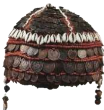
бесермянский головной убор