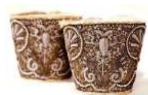
Рис. 6. Запястья. Шелк репсового плетения, нить золотая, блестки, жемчуг. 17 в. Оружейная палата, Музеи Московского Кремля