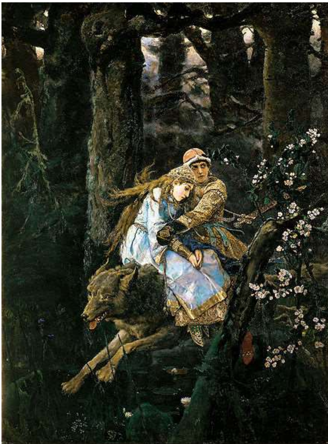
Холст, масло. 249 × 187 см. 1889 г. Государственная Третьяковская галерея, Москва