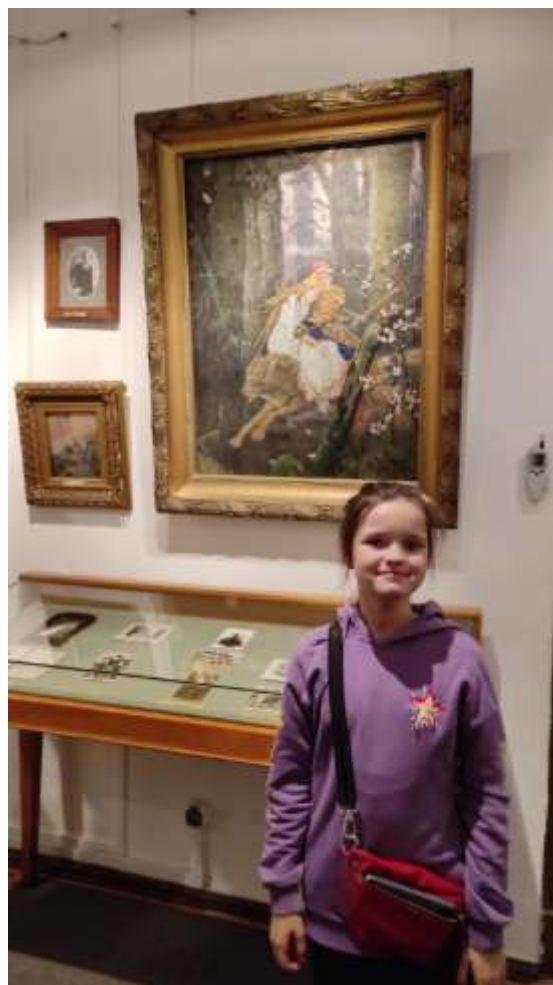
Дом-музей В.М. Васнецова