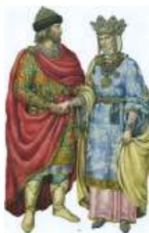
Рис. 4. Княжеский древнерусский костюм (10-13 вв.)

Одежда и украшения Елены Прекрасной. На картине королева изображена в древнерусской княжеской одежде. На ней отделанный золотом по подолу и рукавам небесно-голубой летник , длинные рукава нижнего платья фиксируют золотые поручи (запястья) [2] (рис. 4, 5, 6).