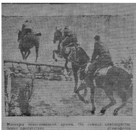
Большевистское слово. – 1938. - №53. – 6 июля. С. 4

Фрагменты газеты «Большевистское слово» (визуальный ряд), являющие откликом на события в Чехословакии в 1938-1939 гг.