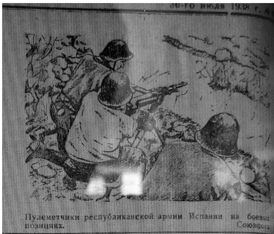
Большевистское слово. – 1938. - №50. - 30 июня. С. 4

Фрагменты газеты «Большевистское слово» (визуальный материал) о ходе Гражданской войны в Испании.