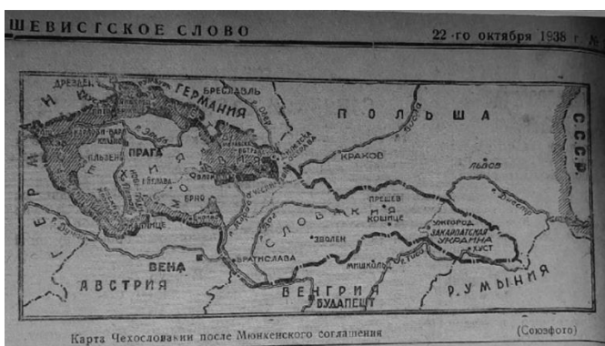
Большевистское слово. – 1938. - №96. – 22 октября. С. 4