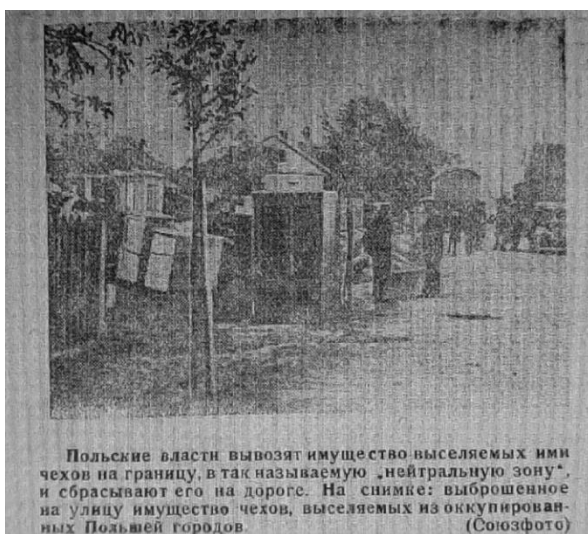
Большевистское слово. – 1938. - №108. - 24 ноября. С. 4