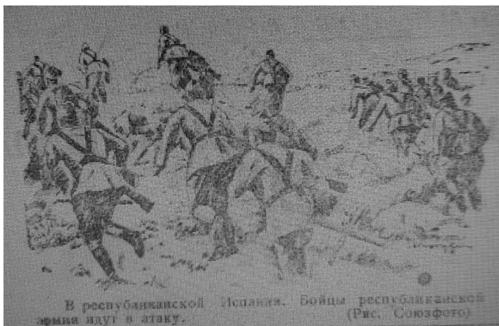
Большевистское слово. – 1938. - №42. - 15 июня. С. 4