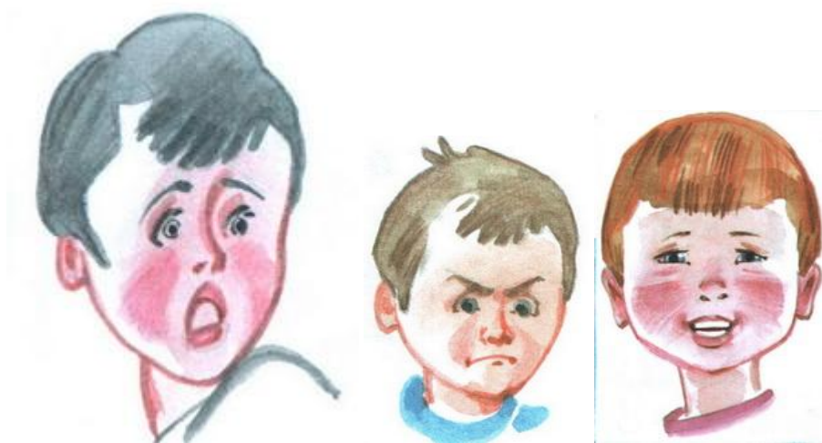
Рис.3. Первая серия. Эмоции

Первая серия (Рисунок 3 и Рисунок 4). Ребенку последовательно показывают картинки детей и взрослых и спрашивают: «Кто изображен на картинке? Что он делает? Как он себя чувствует? Как ты догадался об этом? «Опиши картинку»