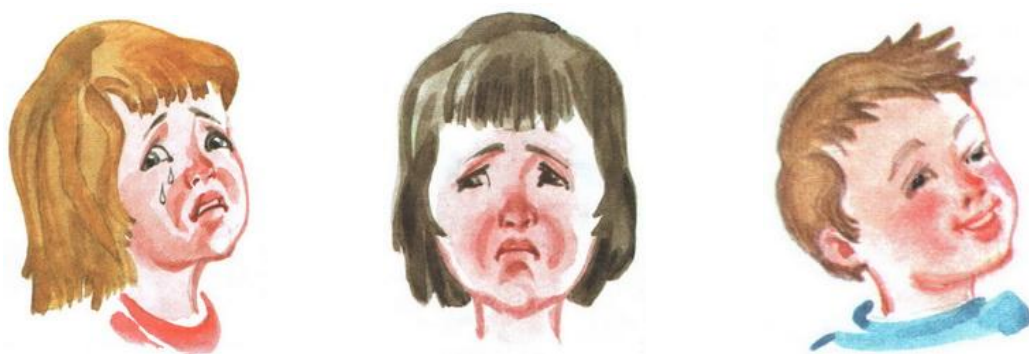
Рис. 4. Первая серия. Эмоции

Вторая серия. Ребенку последовательно показывают сюжетные картинки и задают вопросы: «Что делают дети (взрослые)? Как они это делают (дружно,