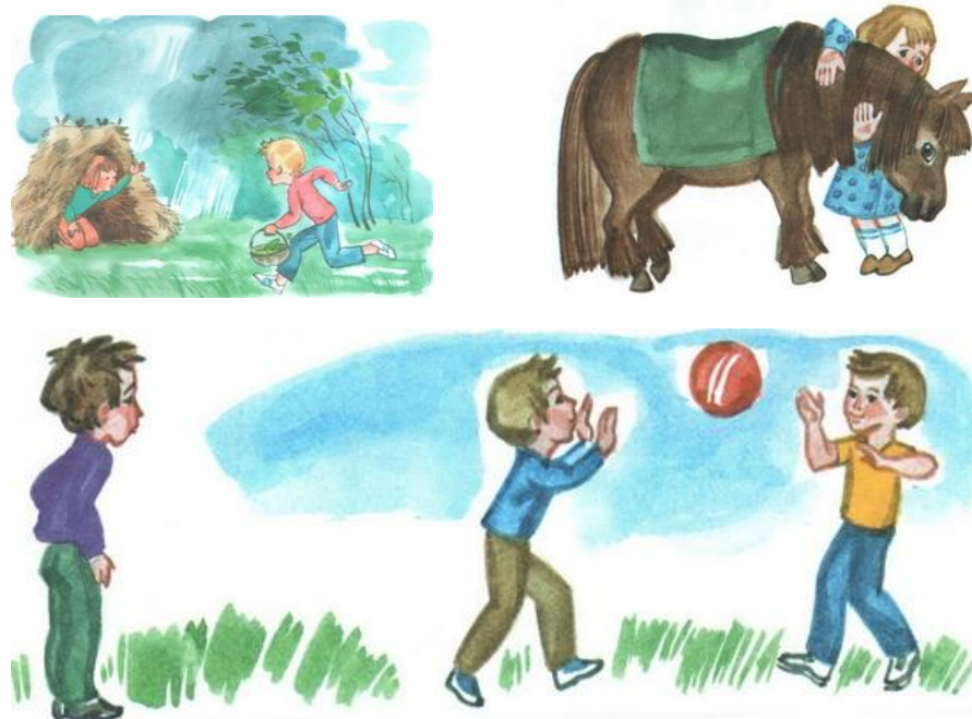
Рис 5. Вторая серия. Сюжетные картинки

ссорятся, не обращают внимания друг на друга и т.д.)? Как ты догадался? Кому из них хорошо, а кому плохо? Как ты догадался?»