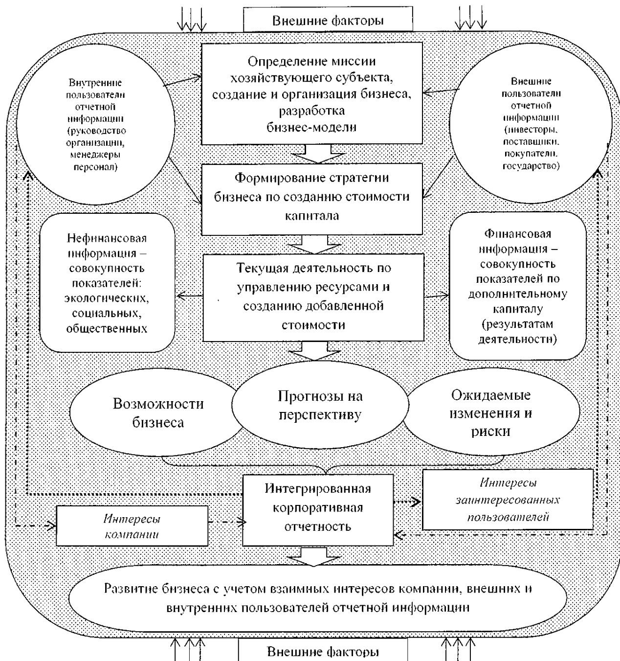
Рисунок 1 – Авторская концепция подготовки интегрированной корпоративной отчетности