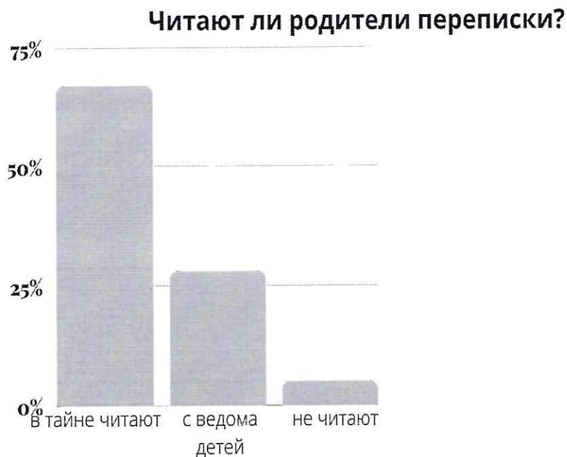
Табл. 4 «Опрос родителей»

Обращу внимание, что родители, читающие переписку втайне от ребенка, не считают, что тем самым нарушают его права. Факт чтения - они объясняют своей ответственностью за его жизнь и здоровье, факт тайности – нежеланием его обидеть.