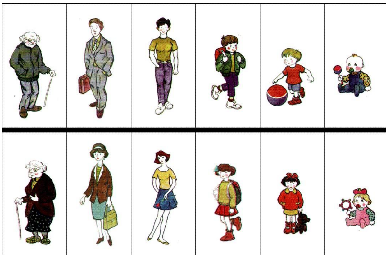
Рис. 3. Стимульный материал для проведения теста

Если ребенок сделал адекватный выбор картинки, можно считать, что он правильно идентифицирует себя с соответствующим полом и возрастом.