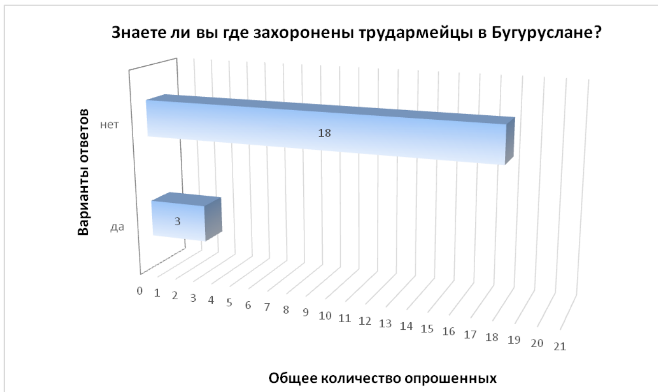
Схема анкетирования учеников 6 класса