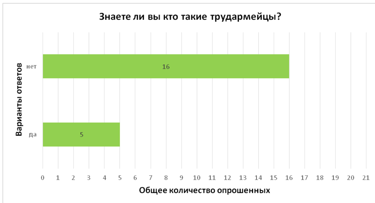
Схема анкетирования учеников 6 класса