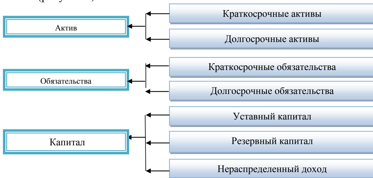
Рисунок 2 - Структура объектов бухгалтерского учета ТОО «Умит2020»

ТОО «Умит2020» составляет на основе данных синтетического и аналитического и аналитического учета финансовую отчетность. Финансовая отчетность включает: бухгалтерский баланс; отчет о прибылях и убытках; отчет об изменениях капитала; отчет о движении денежных средств;) пояснительную записку. Структура имущества, обязательства и капитала ТОО «Умит2020» состоит из (рисунок 2):