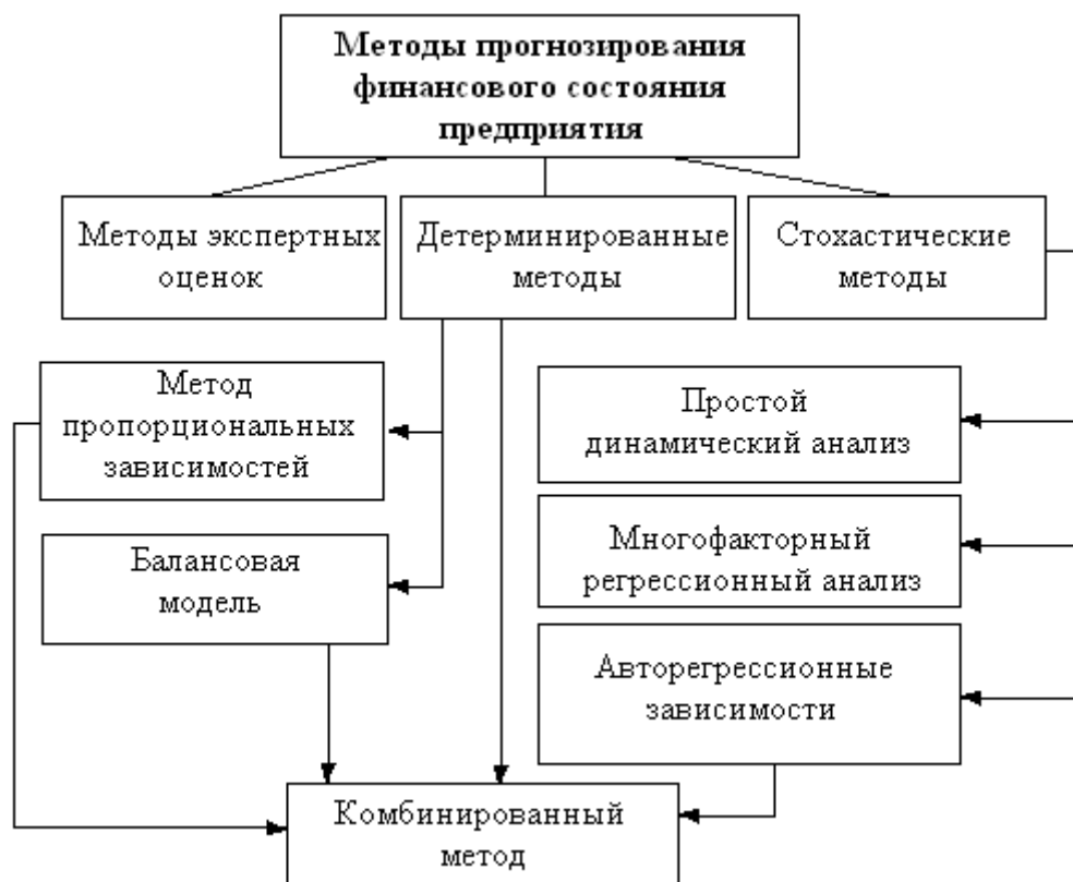
Рисунок 4 – Классификация методов прогнозного анализа

Примечание – составлено на основе источника [25]