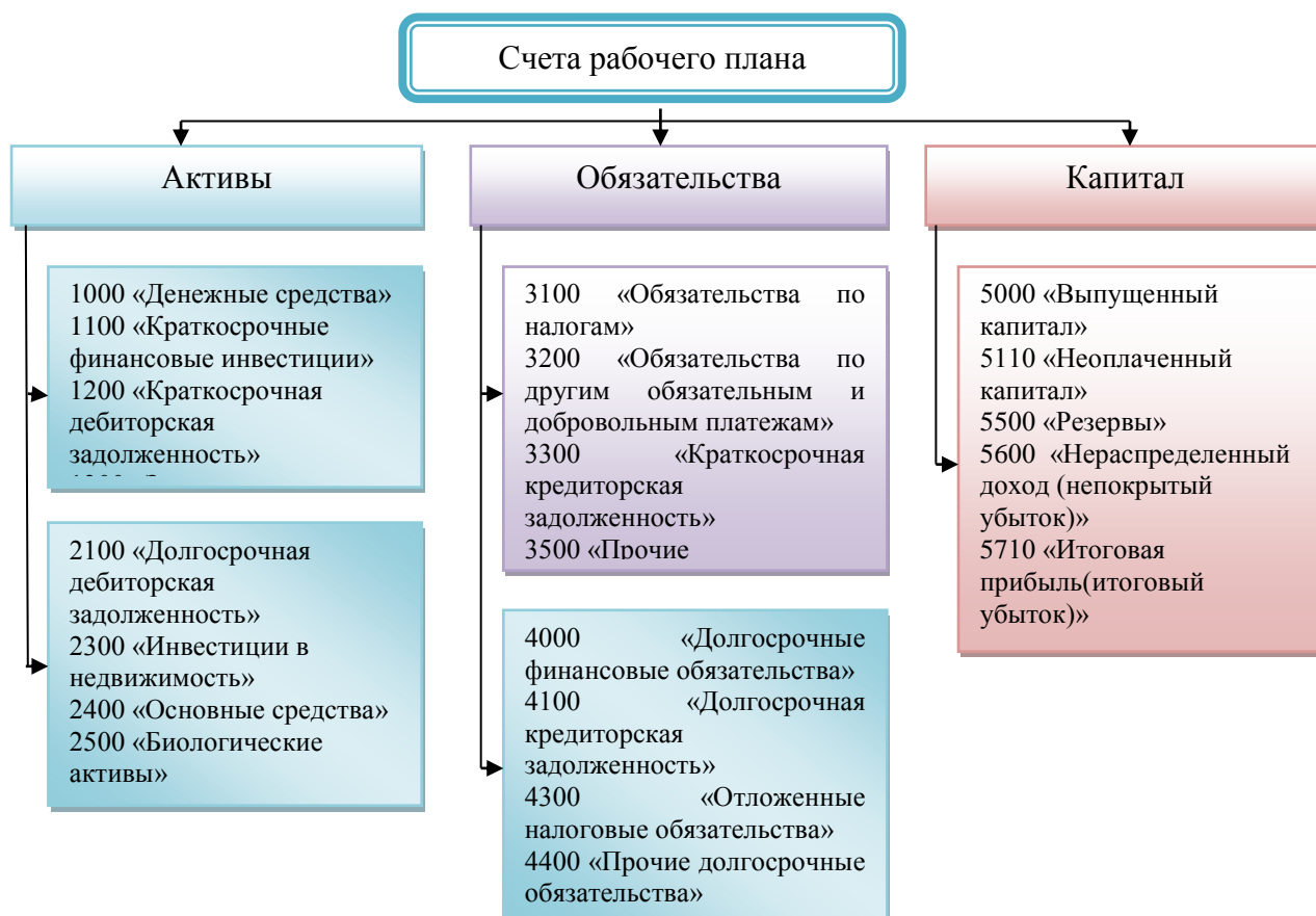
Рисунок 3 – Счета, применяемые для учета активов, обязательств и капитала ТОО «Умит2020»

Примечание – составлено на основе данных ТОО «Умит2020»