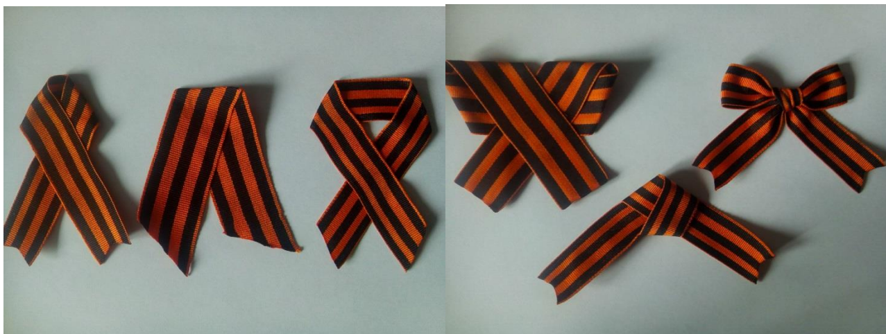
Петелька Галочка Бант простой Бант Бабочка Бант изящный