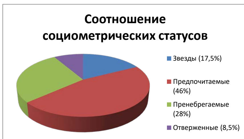
Рис.1 Результаты соотношения социометрических статусов в группах исследования.

Результаты соотношений социометрических статусов респондентов в группах продемонстрированы на рисунке 1.