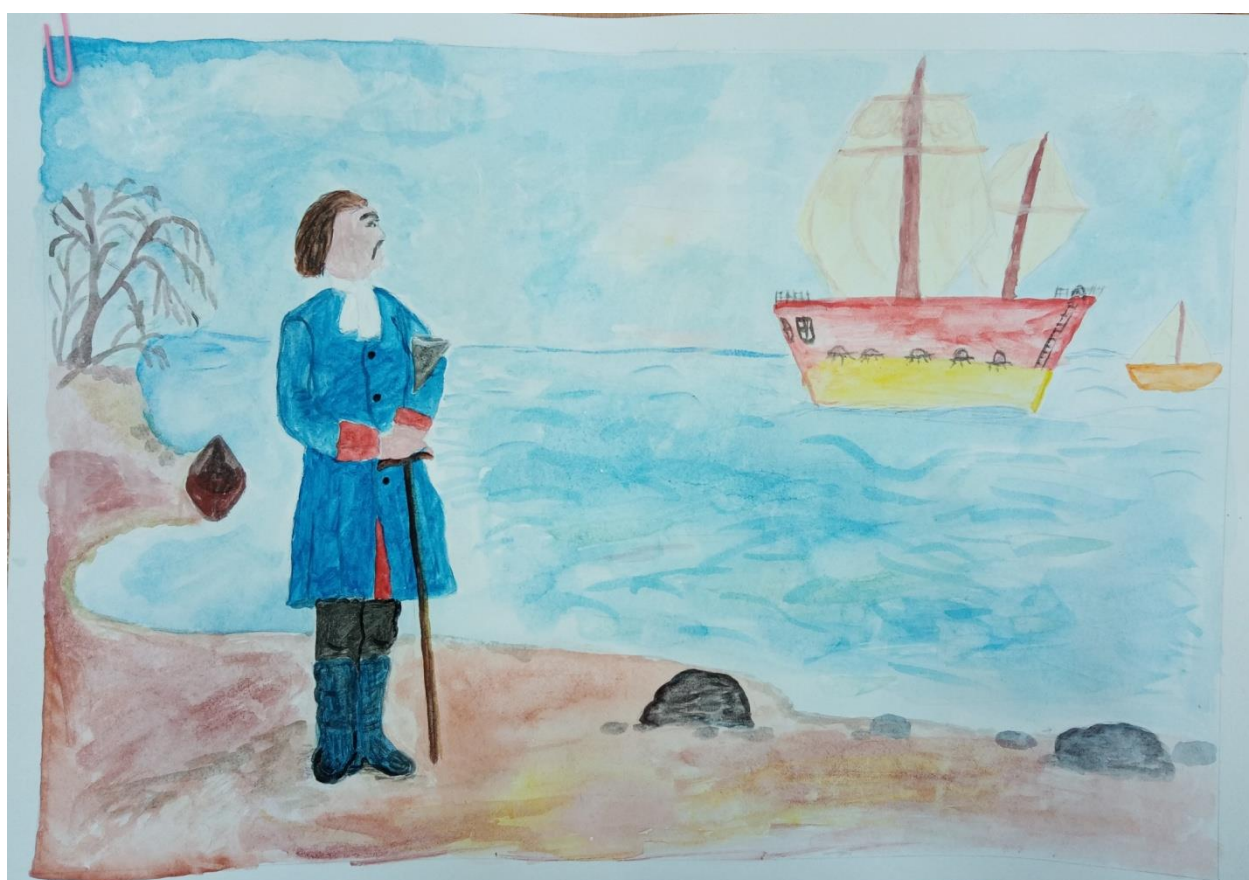
Рисунок «Мечты Петра I» Агафонова Варвара