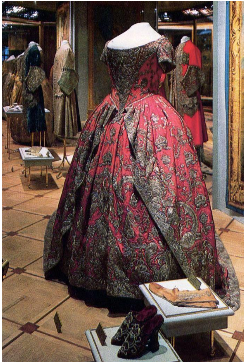
Женский костюм. XVIII в.