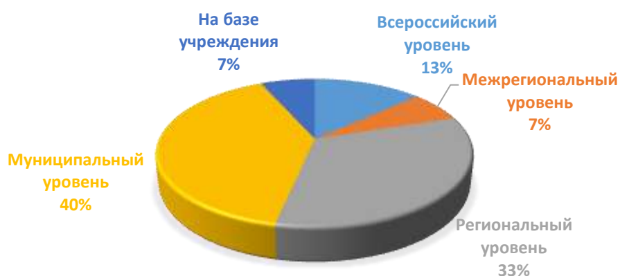
Диаграмма 1. Участие в конкурсах различного уровня за последние три года.

Обучающиеся достигли стабильно высокого уровня мастерства. Прямое подтверждение этому – многочисленные дипломы за участие в конкурсах различного уровня. Можно сказать, что поставленные в образовательной программе цели и задачи, успешно выполняются.