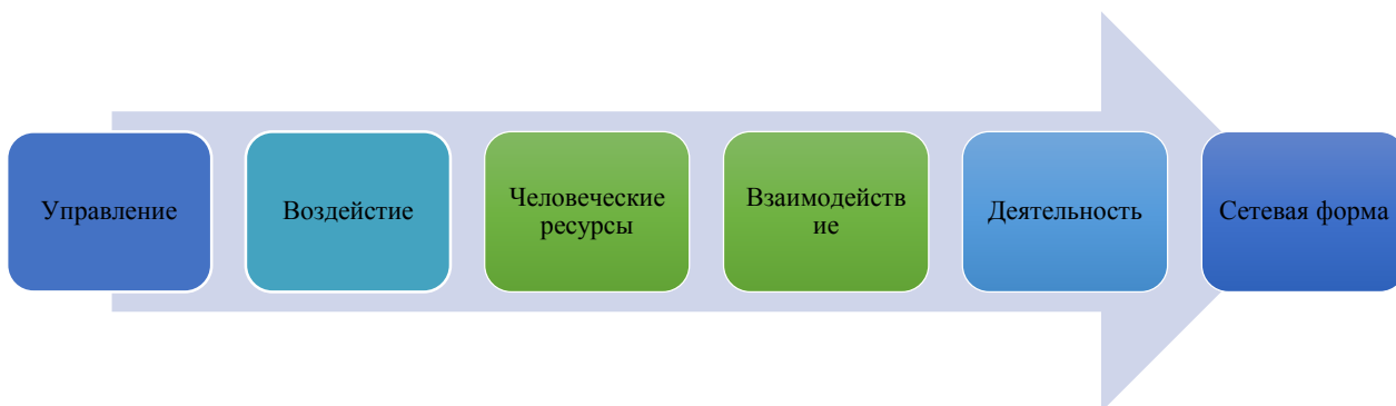
Рис.3 – Этапы развития управления сетевой формой образовательных программ

ресурсы, то есть на индивидуальные качества сотрудника, обуславливающие его продуктивность труда. После чего происходит процесс взаимодействия, который, в свою очередь, воспроизводит деятельность сетевой формы реализации образовательных программ.