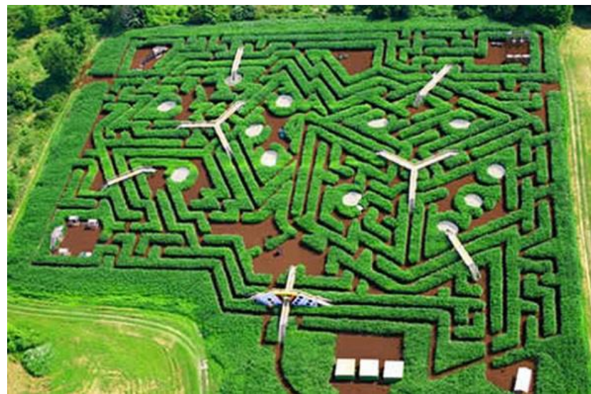
Создание природных лабиринтов