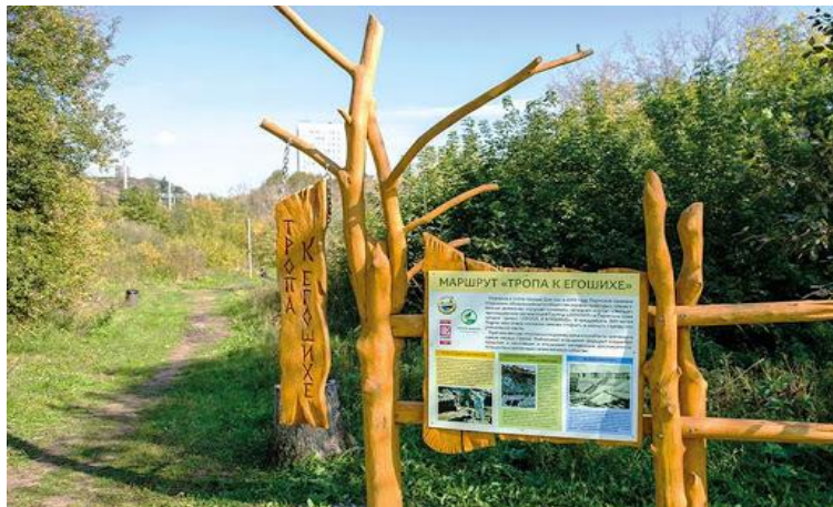
Проложить сельские тропы для реализации/создания: квестов, дорог-здоровья