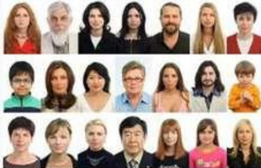
фото на документы