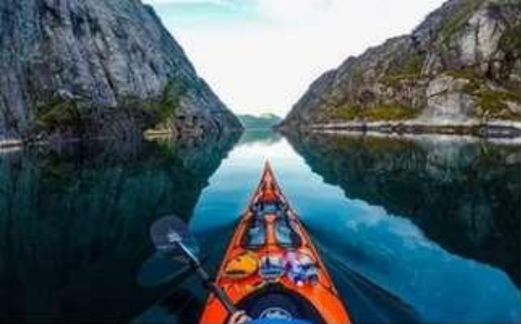
фото в путешествиях