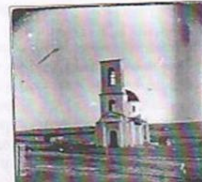
На этой старой фотографии храм запечатлён с колоколом. Но в 60-е годы она была разрушена, сняли и последний колокол.

В разное время в здании храма располагались ремонтная мастерская, потом гараж, склад минеральных удобрений.